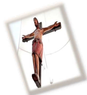
Cattedrale Santa Maria Maggiore Crocifisso Normanno (Sec. XII)