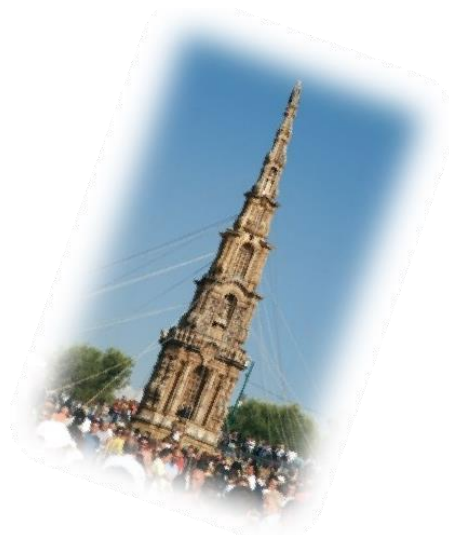
Obelisco di paglia