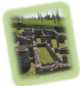
Parco Archeologico Aeclanum